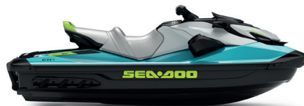
● Teal Blue and Manta Green