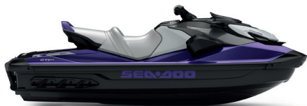
● NEW Midnight Purple