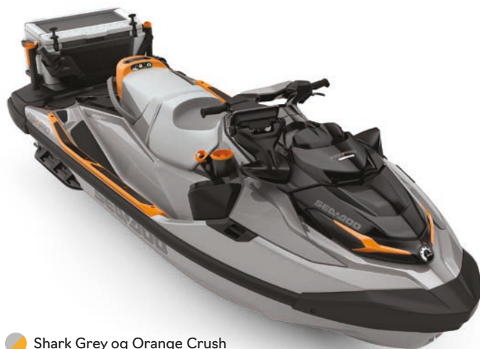
Shark Grey og Orange Crush